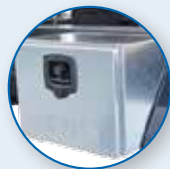
CASSETTA PORTA ATTREZZI ZINCATI