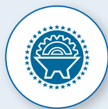
UNABHÄNGIGE HYDRAULISCHE KIPPVORRICHTUNG