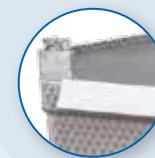
ÖFFNUNGSBARE EDELSTAHL BORDWAND