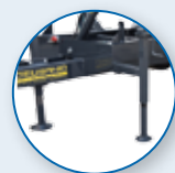
PIEDINO STABILIZZATORE LATERALE