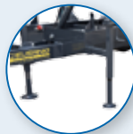
PIEDINO STABILIZZATORE LATERALE