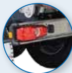
PARAURTI POSTERIORE LUCI INOX