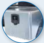
CASSETTA PORTA ATTREZZI ZINCATA