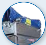
COPERTURA SEMIAUTOMATICA CON TELO