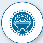
TUBO E GANCI PER TELO