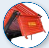
HINTERE VERSTÄRKTE SÄULEN, ÖFFNUNG AUF DEM KOPF