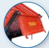
HINTERE VERSTÄRKTE SÄULEN, ÖFFNUNG AUF DEM KOPF