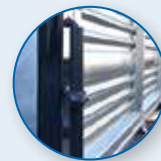
HEISS VERZINKTE BORDWÄNDE