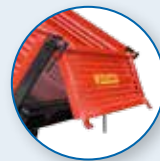
HINTERE VERSTÄRKTE SÄULEN, ÖFFNUNG AUF DEM KOPF