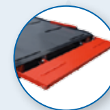
HECKPALETTE 40 CM HÖHE ÜBER DIE GANZE LÄNGE