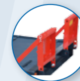
EINZELNE PALETTEN 40 CM HÖHE