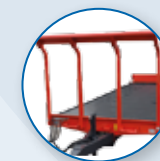
FRONTSTÜTZEN FÜR RUNDBALLEN