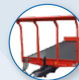
SUPPORTO ANTERIORE PER ROTONI