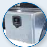
CASSETTA PORTA ATTREZZI ZINCATA