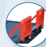
PEDANE SINGOLE ALTEZZA 40 CM