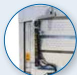
APERTURA POSTERIORE IDRAULICA