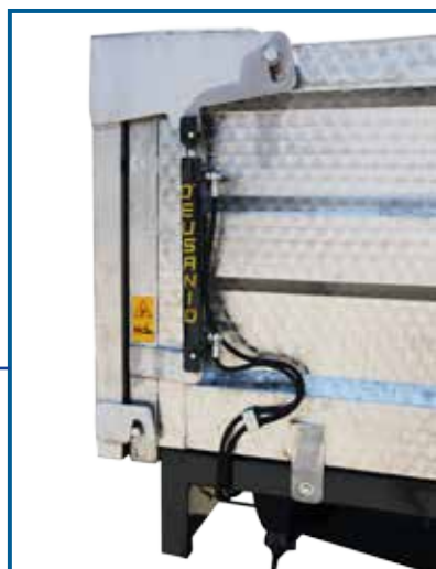
APERTURA POSTERIORE IDRAULICA

L'azienda D'Eusanio costruisce, su richiesta, vasche di qualsiasi dimensione e spessore, da montare su pianali di qualunque tipo di rimorchio o camion.